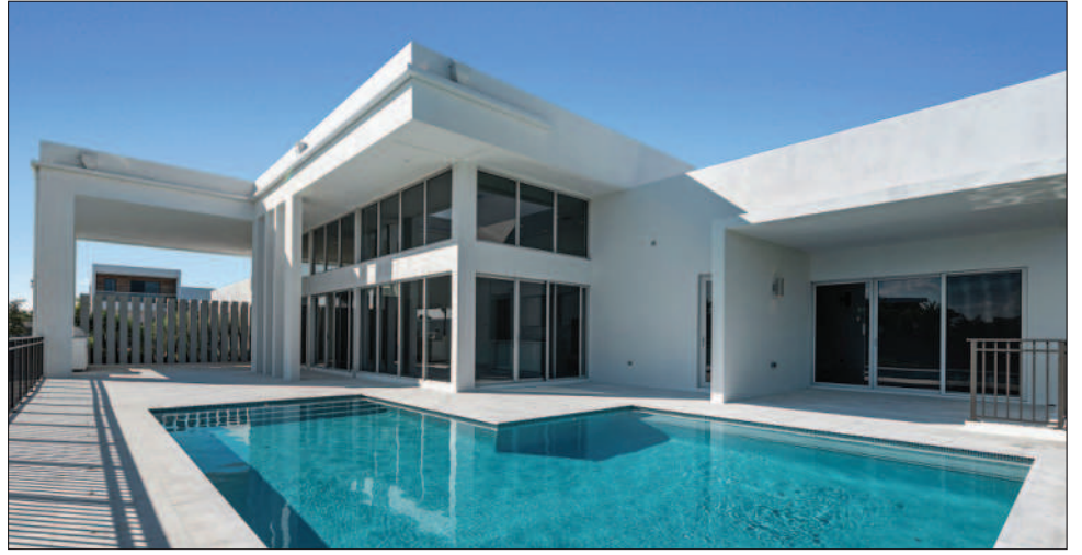
La casa es una obra maestra moderna elegante y lujosa.

La única urbanización en Weston con casas nuevas y modernas, Botaniko es uno de los enclaves más deseables de la ciudad. Todas las casas de Botaniko Weston tienen componentes de casa inteligente, techos de