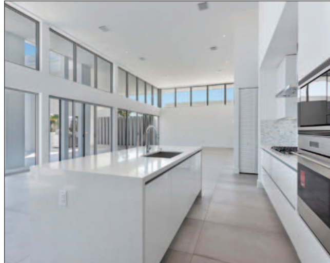
La cocina está muy bien equipada.