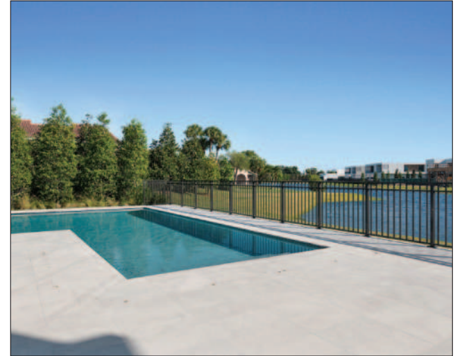
La casa se alza en una parcela esquinera de 16.124 pies cuadrados.

hormigón, ventanas de impacto y gas natural provistos a través de un sistema soterrado. Las casas de lujo de este tipo se pueden comparar con las de Miami Beach y Coral Gables, pero el precio por pie cuadrado es mucho más asequible. Para más información, llame a Fernando Paiz al 954-205-4255 o acceda a www.ThePaizGroup.com .